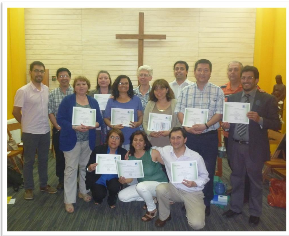
Fotografía: Certificación Diplomado en Formación Psicoespiritual para Educadores Profesores de la Versión 2014