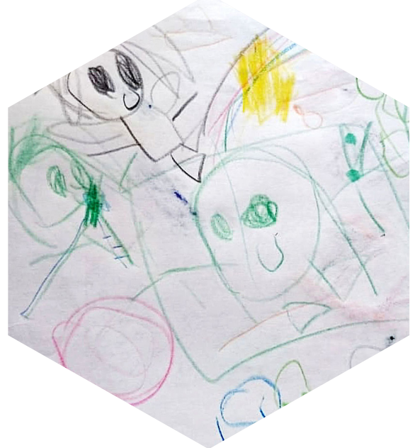
Arriba. Ilustración 1: