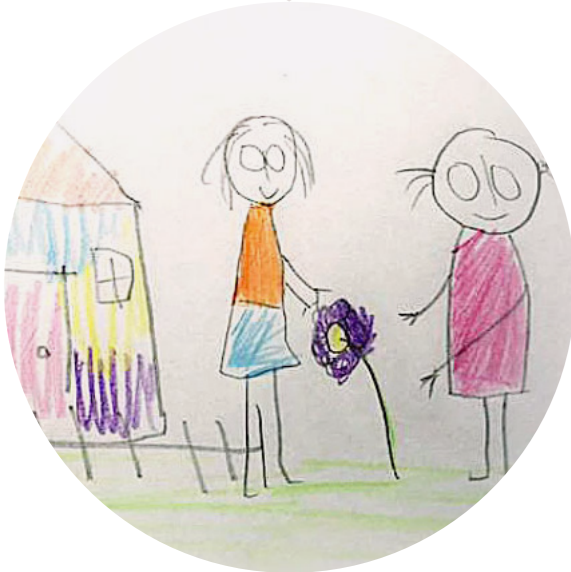
Ilustración 5: Párvulo medio mayor, Nivel 1 en TQHE

“Creo que se deberían potenciar las habilidades de cada alumno , por ejemplo, si yo soy buena en artes y mala en ciencias, me den la oportunidad de avanzar en lo que me destaco que sería las artes y no tratar de igualar mis aprendizajes de ciencias . Con esto se lograría un mayor desempeño y disposición de parte de los alumnos, porque estarían haciendo lo que de verdad les gusta y en lo que se destacan , lo que a largo plazo nos daría profesionales capacitados y preparados desde pequeños y personas más felices :) ”